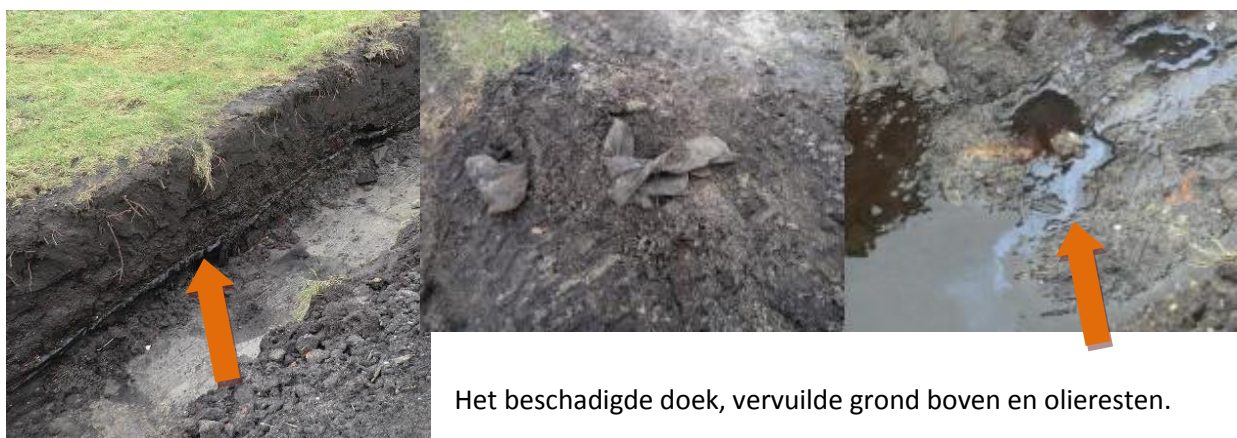
Het beschadigde doek, vervuilde grond boven en olieresten.