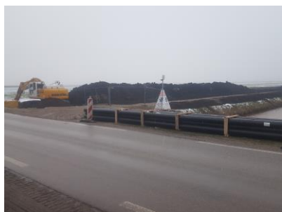
2 x 1 e Exloermond

12 Februari om 12.00 uur, Kneuterdijk 22 Den Haag