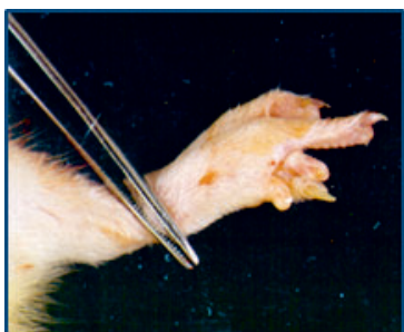
Labrat misvormde poot blootgesteld aan LFG

Ook zijn bestuursleden van Stichting Windturbine Megaschade Claim aanwezig om u te informeren over de procedure rond het indienen van een schadeclaim!